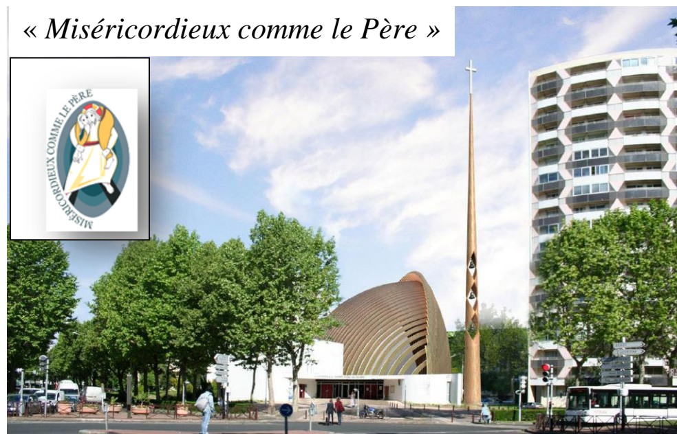
La nouvelle cathédrale de Créteil